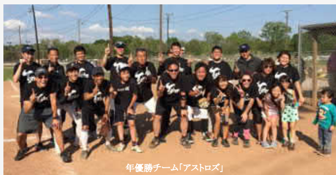
年優勝チーム「アストロズ」

毎年熱戦が繰り広げられるソフトボール大会です。ご家族やお知り合いと一緒に、観戦・応援をよろしくお願ひします。さて、今年の大会はどんな試合展開となるでしょう。乞うご期待!!