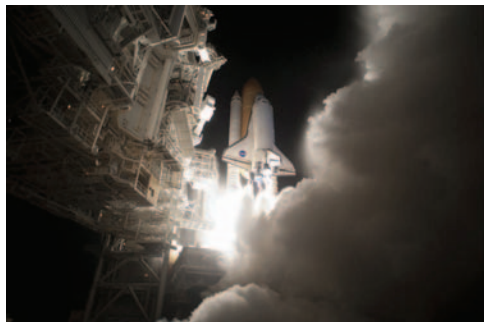
打上げの様子(飛行1日目)

スペースシャトル「ディスカバリー号」は、米国東部時間4月5日(月)午前6時21分にケネディ宇宙センターから打ち上げられました。