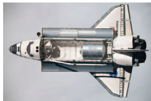
ISSからの分離後にISSから撮影された「ディスカバリー号」(飛行13日目)