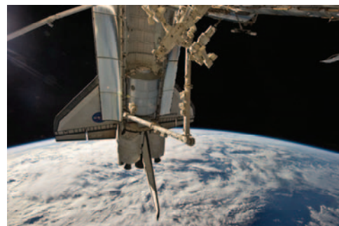
ISSのロボットアームによる「レオナルド」の移設の様子(飛行4日目)