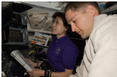
スペースシャトルのフライトデッキで作業をする山崎(左)、ダットン(右)両飛行士(飛行2日目)

ISSのロボットアームを用いて、補給物資を搭載した多目的補給モジュール「レオナルド」をスペースシャトルのカーゴベイ(貨物室)から取り出し、ISSに結合させました。山崎飛行士は、ウィルソン飛行士とともに、ISSのロボットアーム操作を担当しました。