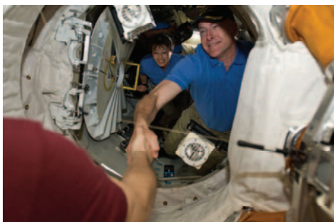
ISSとスペースシャトル「ディスカバリー号」間のハッチオープンの様子(飛行3日目)