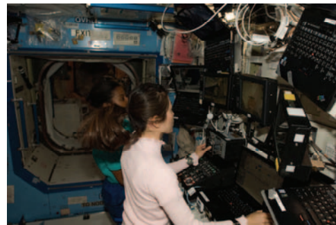
ISSのロボットアーム操作を行う山崎(手前)、ウィルソン(奥)両飛行士 (飛行11日目)