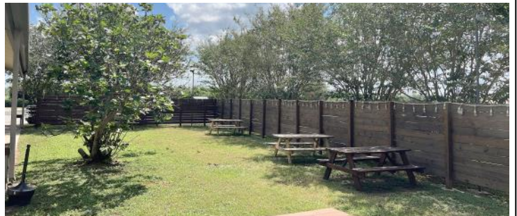
▲入口付近では、外で食べられるスペースもあります