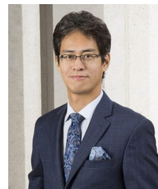
Adair Myers Stevenson Yagi PLLC 弁護士：八木 謙一

一般的な説明は以上のとおりですが、法的リスクは事案により千差万別です。雇用時の「三種の神器」をうまく活用することが重要ですが、ハンドブックがテキサス州の実態に即していない企業や、人事担当者がその内容を熟知していないケースも少なくありません。アメリカは訴訟大国です。雇用体制が万全かどうか、再度チェックすることをお勧めします。今後も事業や生活に不可欠な身近な法律問題について取り上げたいと思いますので、ご希望のテーマがありましたらお気軽にご連絡ください。