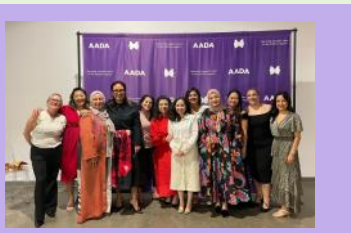
AADAチームメンバー (2024年2月のGALAにて)

初めまして。私たちAsians Against Domestic Abuse(通称AADA)はドメスティックバイオレンス(以下DV)被害者を支援することを目的として、2001年に設立された非営利団体です。運営はボランティア、寄付、助成により成り立っています。米国内国歳入庁(IRS)からは、公益法人として、501(c)3の承認を得ています。2021年より、在ヒューストン日本国総領事館と提携し、テキサス州及びオクラホマ州に在住の邦人DV被害者の支援を行っております。