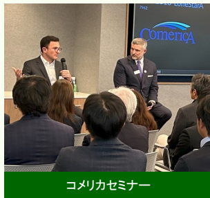
コメリカセミナー

コメリカ銀行、アメリカンフットボールチーム（NFL所属）のダラス・カウボーイズの本社を見学させていただきました。コメリカ銀行は創立175年の歴史を持ち、2007年には全米をカバーする上で地理的にも戦略的な位置にあるダラスに本社を移転。現在、日本人の方も勤務されています。当日は2名のSVPより、同行が注力するSmall BusinessやStart Up企業向けの比較的小口の投融資、Co-work Spaceの提供等のサービス内容、大統領選挙が米国経済に及ぼす影響、および成長中のテキサス経済の今後の見通しについてご説明を頂きました。