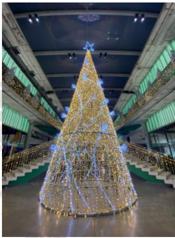
▲ダウントウンPOSTのツリー

ダウントウン新スポット、ポスト屋上芝生エリアにて開催中のホリデーイルミネーション。25フィートのクリスマスツリー、10万個の電飾でデコレーションされたスカイラウンとヒューストンの夜景を楽しんでみませんか。入場料は7