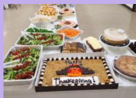
昨年のThanksgivingに行ったイベント (クライアントを招待)

日本の文化、社会において、家庭のことを第三者に話すことは恥であるという考え方、代々家庭内の女性に暗黙の了解で求められてきた自己犠牲の精神などが障壁となり、相談することすら非常に難しい現実があります。また、意を決して誰かを頼った時に「なんで逃げないの?」「この家でもそれくらい当たり前でしょ」とかえって傷を深めることを言われることも残念ながら多々あります。特に配偶者を頼って帯同してアメリカに来た方にとって、日本と同じように情報を探し適切な支援を受けることは、困難を極めます。