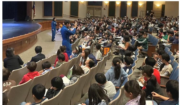
▲写真:会場風景(質疑応答)

(米田) 宇宙飛行士の訓練は新しく覚えることが多い。難しいと思うこともあるが、見方を変えると面白い一面もある。新しいことを上手に学ぶ勉強のスタイルが身に付いた。