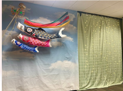
◀鯉のぼりと電飾の撮影エリア