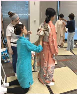
▲他装の着付け練習風景