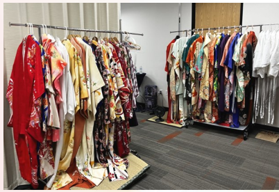
◀準備された振袖と訪問着