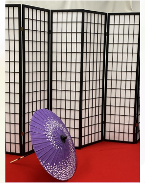
▲和風の撮影スタジオ