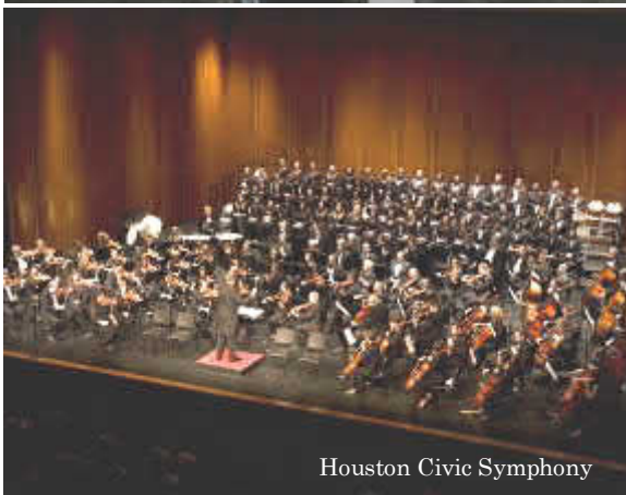
Houston Civic Symphony