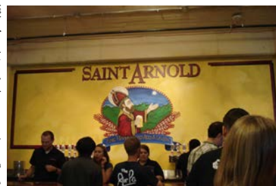
St. Arnold Brewery

ダウンタウンの少し寂れた工場街の一面にあるのは、知る人ぞ知るセント・アーノルド・ビールの醸造所。受付で入場料8ドルを払うとTokenというコイン4つと300ミリリットルくらい入るグラスが渡される。8ドルでできたてのビールを4杯試飲できる上、グラスもお土産として持つことができる。ビール工場見学の後にお楽しみの試飲というパターンとは違って、ここで