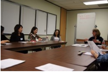
"Paper or plastic?" "I have my own bag."