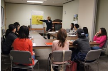
上段、右から3つ目のハムを欲しい時、何と言いますか？