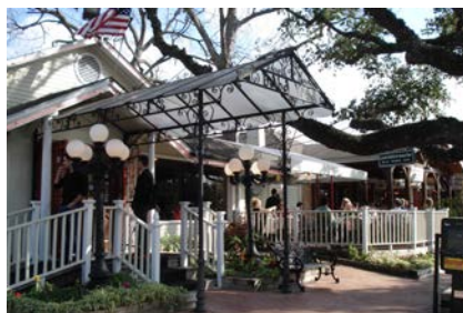
Baba Yega Restaurant

ニューヨークタイムズがヒューストンを選んだ理由は、エネルギー産業の中心地であるだけでなく、“Cultural and Culinary Capital(文化と食の中心地)”でもあるということ、すなわちミュージアムとレストランの充実度だそう。近年全米が注目するレストランとして、Oxheart, Underbelly, Uchiの名が挙げられている。実