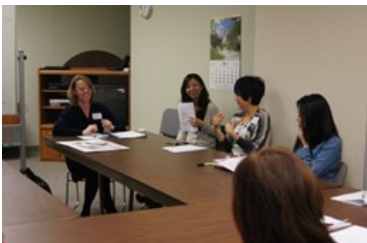
美容師が髪をどんどん切ってしまう困った時、何と言ったらいいのか..。

“Would you like to donate to XXX?” と、スーパーのレジで聞かれるたびに、ここはYesとすべきかNoとすべきか...Noってうただけじゃなんだから、なんか気の利いた理由の一言も言わねばと、しどろもどろ。理由なき罪悪感もわいてきて、「もう、めんどくさい！」と結局1ドル寄付してしまっ...などという経験はありませんか？