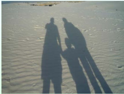
ホワイトサンズ国立公園にて

約1年前のEasterの連休に、エルパソ、ホワイトサンズ、サンタフェを廻る旅行を計画。友人から情報を集め、エルパソまでは飛行機、その後はレンタカーで移動することに決定。Good Friday前日夜の便に乗る為、夫から「16時半で余裕だと思うけど、念の為16時に出られるように。」とのお達し。常日頃のんびり屋の私は、16時出発を目標に準備するものの、頭のどこかで「16時半でも大丈夫でしょ」という思いもあり、気がつけばもう16時過ぎ。夫に急かされながら、結局家のガレージを出たのは16時半。既に不機嫌モードの夫に「16時半でも大丈夫って言ったじゃない。」と取り繕うその数分後、I-10の大渋滞に突入。続くBeltway 8でも車の列が途切れることなく、「これはヤバイな・・・」と苦虫を噛み潰したような顔になる夫の横で、私はひたすら「どうかフライトには間に合いますように！」と苦しい時の神頼み。その願いも通じずIAHまで2時間以上もかかり、本当に乗り遅れてしまったのである。これまで