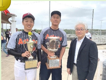
▲優勝トロフィー授与 アストロズ