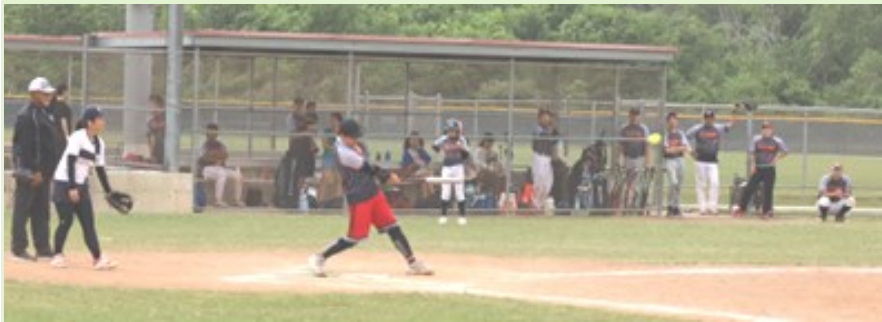
▲白熱の決勝戦 Storms vs アストロズ