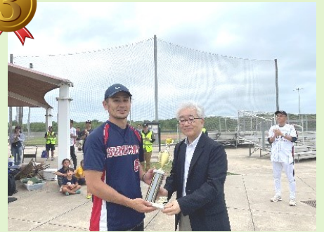
▲3位トロフィー授与 住友ダッシュ