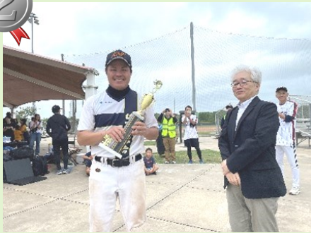
▲準優勝トロフィー授与 Storms